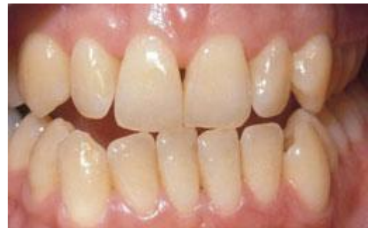
Voor het bleken