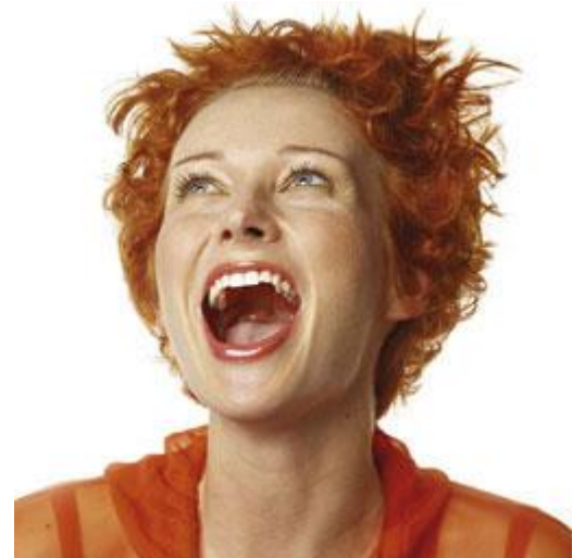
Het bleekresultaat verschilt voor iedereen

Het bleekresultaat verschilt voor iedereen. De basiskleur van uw tandbeen bepaalt voor een belangrijk deel het uiteindelijke resultaat. En die basiskleur is bij iedereen anders. Het bleekresultaat is soms niet blijvend. In een aantal gevallen komt de verkleuring na een paar jaar weer terug. De vorming van tandbeen gaat namelijk gewoon door. Ook gebleekte tanden zullen, net zoals niet-gebleekte tanden, op den duur verkleuren door veroudering. Dit proces gaat sneller als u rookt of bepaalde voedingsstoffen veel gebruikt. Het effect van langdurig of herhaald bleken op het tandweefsel is niet helemaal bekend.