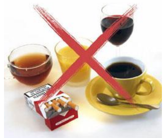
Tijdens de behandeling met de bleeklepel is het gebruik van deze producten af te raden

Door het bleken, wordt het glazuur van de tanden en kiezen iets poreuzer. Dat is tijdelijk. Het glazuur herstelt zich weer. Tijdens de behandeling met de bleeklepel kunnen bepaalde etenswaren en dranken het resultaat nadelig beïnvloeden. Voorbeelden daarvan zijn koffie, thee, rode wijn, koolzuurhoudende frisdranken, citrusvruchtensap en kleurstof bevattende etenswaren (zoals vruchtenjam). Tijdens de behandeling is het gebruik van deze producten, evenals roken, af te raden.