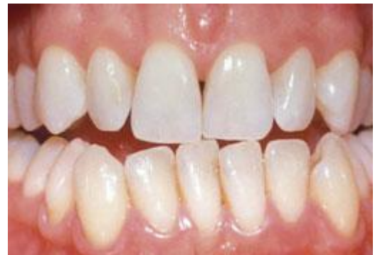
Resultaat na tien dagen bleken met de thuisbleekmethode onder begeleiding van de tandarts

De lengte van een bleekbehandeling hangt af van de bleekmethode. Bij de thuisbleekmethode duurt het meestal twee weken voordat u een gewenst resultaat bereikt.