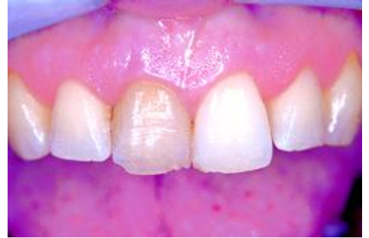
Verkleuring door een dode tand

De hoge concentraties peroxide tasten de slijmvliezen (het tandvlees en wangen) aan. Daarom worden het tandvlees en de wangen bij deze methode goed beschermd. Nadat de tandvleesbescherming is verwijderd, blijkt soms toch lekkage te hebben plaatsgevonden. Hierdoor ontstaan witte 'brand'plekken op het tandvlees, tong of lippen. Deze verdwijnen vanzelf binnen enkele uren. De aantasting van het glazuur is minimaal en vergelijkbaar met de effecten van de thuisbleekmethode.