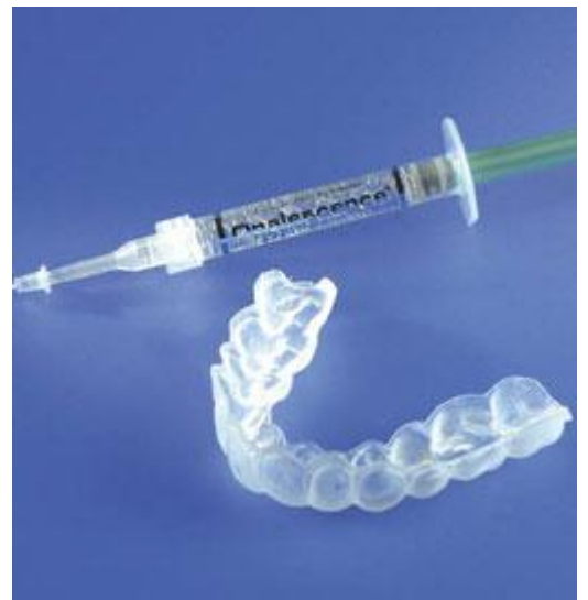
Van de tandarts of mondhygiënist krijgt u de doorzichtige bleeklepel en de gel met de blekende werking mee naar huis

Bleken in de tandartspraktijk gebeurt vaak bij lokale verkleuringen. De tandarts gebruikt in zijn praktijk aanzienlijk hogere concentraties peroxide dan bij de thuisbleekmethode. Vaak gebruikt hij een bleeklamp of soms een laser, waardoor het bleekproces sneller gaat.