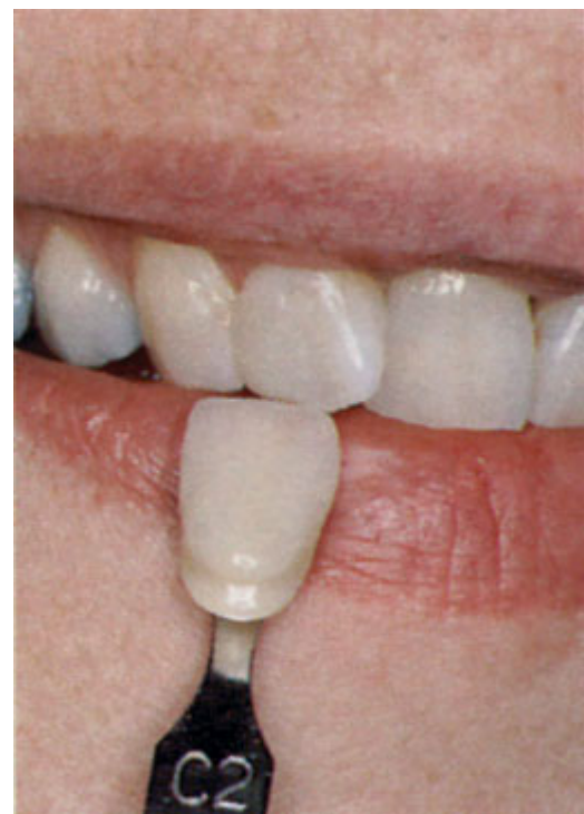
De gewenste kleur bepalen

Als het nodig is, slijpt de tandarts een heel dun laagje van het oppervlak van uw tand af. Zo maakt hij ruimte voor de facing. Als dit niet gebeurt, wordt uw tand iets dikker.