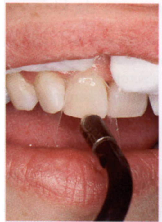
De hechtlaag is aangebracht

Nadat uw tandarts de composiet op uw tand heeft geplakt, boetseert hij het vulmateriaal eerst globaal in de juiste vorm. De tandarts beschijnt de composiet met een blauw licht als de gewenste vorm is bereikt. Hiermee maakt hij de composiet hard. Ten slotte slijpt hij de composiet in de gewenste vorm en polijst hij het oppervlak. Dan is de facing klaar. Als u de vorm of kleur niet goed vindt, kan uw tandarts de facing, na het wegslijpen van een laagje composiet, direct corrigeren.