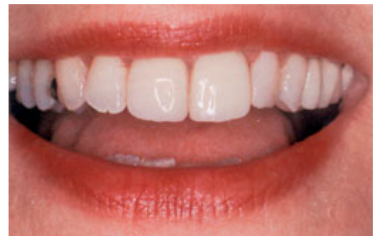
De facing van composiet heeft zowel de kleur als de stand van de tanden verbeterd