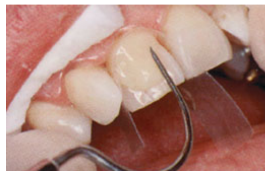
De tandarts brengt de composiet op het oppervlak globaal in vorm

Uw tandarts maakt een afdruk van uw tand. Die afdruk gaat naar het tandtechnisch laboratorium. Daar maken ze uw facing in de gewenste vorm.