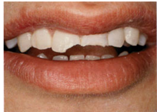
Door een val zijn twee tanden gebroken