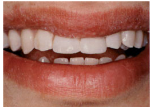
Nog dezelfde dag zijn de tanden met composiet hersteld