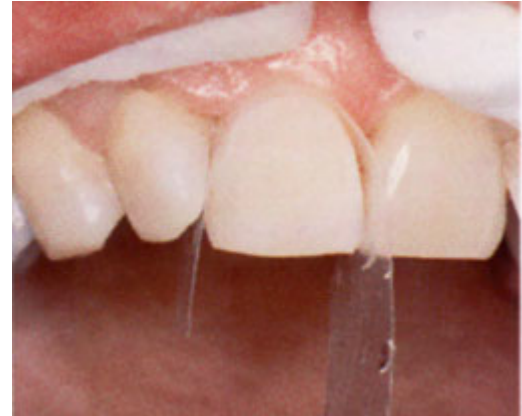
Nadat de ongeslepen tand is voorbehandeld met een zuur ziet het oppervlak er mat uit

Voordat uw tandarts de composiet aan uw tand plakt, behandelt hij uw tand voor met een zuur. Ook brengt hij een hechtlaag aan op uw tand. Op deze laag bevestigt hij de nog zachte composiet.