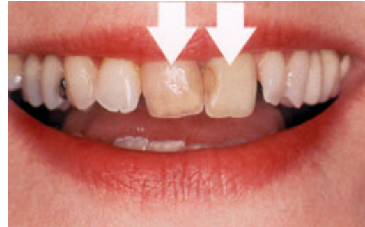
De tanden zijn verkleurd en staan niet mooi op een rij

Een facing gaat vijf tot tien jaar en soms ook langer mee. Roken en veel koffie of thee drinken, werkt verkleuring in de hand. Een facing kan slijten of beschadigen als u bijvoorbeeld tandenknarst of op uw nagels bijt. De tandarts kan een gesleten of beschadigde facing altijd repareren of vervangen. Deze behandeling beschadigt de tand zelf niet.