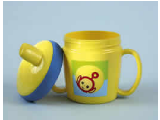
Laat uw kind vanaf 9 maanden uit een beker drinken

Vaak sabbelen aan een zuigflesje of anti-lekbeker met bijvoorbeeld vruchtensap, siroop, drinkyoghurt en andere melkproducten kan het gebit aantasten. Omdat het gebit langdurig met suikers in aanraking komt, is er een grote kans op het ontstaan van zogenoemde zuigflescaries. De kans hierop is kleiner als kinderen hun zoete drankjes in één keer opdrinken. Laat daarom uw kind vanaf negen maanden uit een beker zonder tuit drinken in plaats van uit een zuigflesje of anti-lekbeker. Gebruik een tuitbeker eventueel eerst als tussenstap. 's Avonds en 's nachts is het drinken uit een zuigflesje met zoete inhoud extra schadelijk. 's Nachts kan het speeksel de zuuraanvallen op het gebit vrijwel niet herstellen. Het ('s nachts) drinken van water uit een zuigflesje is overigens niet schadelijk.