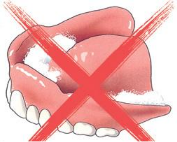
Knutsel nooit zelf aan uw kunstgebit, maar ga ermee naar uw behandelaar

Het dragen van uw nieuwe kunstgebit kan in het begin pijnlijk zijn. Het zit strak tegen uw kaken aan. Op sommige plaatsen misschien wel iets té strak. Daardoor kunnen gevoelige, zogenoemde drukplaatsen ontstaan. Door kleine en eenvoudige correcties aan uw kunstgebit kan uw behandelaar deze pijn wegnemen. Vrij of schuur nooit zelf aan uw kunstgebit! Voor een goed resultaat is het belangrijk dat u uw kunstgebit in uw mond houdt. Probeer er direct mee te praten en te eten. De behandelaar controleert uw kunstgebit enkele dagen nadat het geplaatst is. Heeft u vanwege de pijn of de onwennigheid toch besloten uw kunstgebit uit te doen? Doe het dan minstens een halve dag voor u naar de behandelaar gaat weer in. Anders kan hij niet alle pijnlijke plekken herkennen. Laat u zich er niet toe verleiden uw oude kunstgebit weer in te doen. U zult dan natuurlijk niet aan uw nieuwe wennen. Met uw nieuwe kunstgebit is het vaak een kwestie van doorzetten!