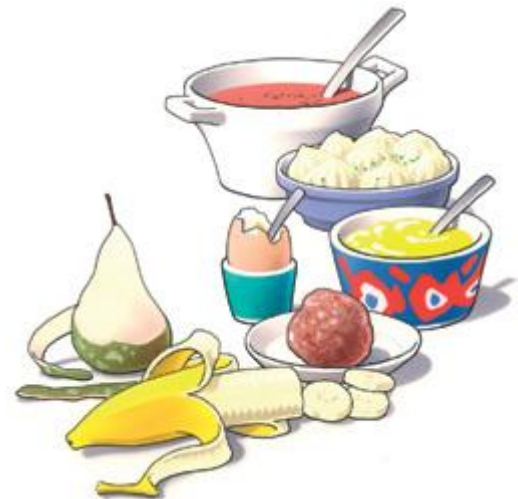
Begin de eerste dagen met zacht voedsel