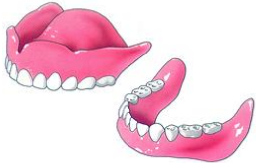
Tanden en kiezen zijn belangrijk voor het kauwen, het spreken en het uiterlijk

Een nieuw kunstgebit is een grote verandering. Uw nieuwe kunstgebit speelt een belangrijke rol bij het kauwen en spreken. Bovendien zijn uw kunsttanden erg belangrijk voor uw uiterlijk. Uw tanden zijn immers uw eerste blikvanger. Zie ook Overkappingsprothese .