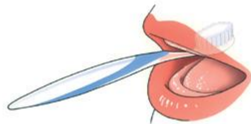
Maak ook uw gehemelte schoon

Reinig uw kunstgebit dagelijks met een bij de drogisterij of apotheek beschikbaar reinigingsmiddel. Volg daarbij de voorschriften van de fabrikant. Vraag eventueel uw behandelaar of mondhygiënist om advies. Leg uw kunstgebit sowieso één keer per week een nachtje in een reinigingsmiddel. Hiermee voorkomt u de vorming van tandsteen op uw kunstgebit. Borstel uw kunstgebit daarna goed en spoel het af met water. Leg uw kunstgebit nooit in heet water en gebruik zeker geen bleekwater of schuurmiddelen.