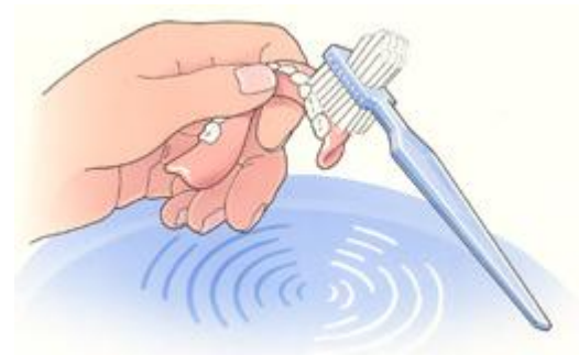
Reinig uw gebit na iedere maaltijd

Uw kunstgebit is nu nog nieuw en mooi. Dat wilt u natuurlijk graag zo houden. Daarom moet u, net als bij eigen tanden en kiezen, uw kunstgebit verzorgen. Als u het niet regelmatig schoonmaakt, blijven er voedselresten achter. Zowel op uw kunstgebit als eronder. Als u die niet verwijdert, kan uw tandvles op den duur gaan ontsteken. Reinig uw gebit daarom zorgvuldig na iedere maaltijd. Gebruik een speciale protheseborstel, bijvoorbeeld van Lactona of Oral-B, en water om etensresten goed te verwijderen. Gebruik géén tandpasta. Die kan te veel schuren. Een schoon kunstgebit voelt altijd glad aan. Laat het gladde gebit tijdens het reinigen niet uit uw handen glijpen. Het zal kapot gaan. Vul voor de zekerheid eerst de wasbak met water en reinig uw kunstgebit daarboven.