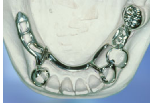
Frameprothese in wording op een gipsmodel, zonder kunsttanden en -kiezen

De frameprothese is gemaakt van metaal. Op het metaal is een tandvleeskleurige kunsthars aangebracht. Daarop zitten de kunsttanden of -kiezen. De frameprothese rust vooral op een deel van de overgebleven tanden of kiezen. Afhankelijk van het ontwerp rust de frameprothese ook meer of minder op het slijmvlies. De tandarts kan de frameprothese op twee manieren bevestigen. Of met metalen ankertjes die om enkele tanden of kiezen klemmen of met een soort slotje. Bij een slotje wordt de ene kant vastgemaakt aan een kroon, tand of kies en de andere kant zit vast aan de frameprothese. De frameprothese kunt u op die manier in het slotje schuiven. Het slotje zit doorgaans aan de binnenkant van de tanden en kiezen en is dus niet vanaf de buitenkant zichtbaar. Ankertjes zijn vaak wel enigszins zichtbaar.