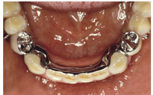
Frameprothese met verankering op kronen