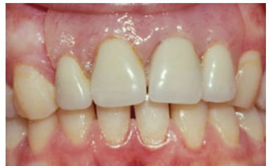
Plaatprothese van voren

De plaatprothese is gemaakt van een roze, tandvleeskleurige kunsthar. Daarin zijn de kunsttanden en kiezen verankerd. De gehele plaatprothese rust op het slijmvlies van de mond. Deze zit eventueel met ankertjes vast aan overgebleven tanden of kiezen.