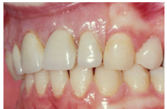
Plaatprothese van opzij