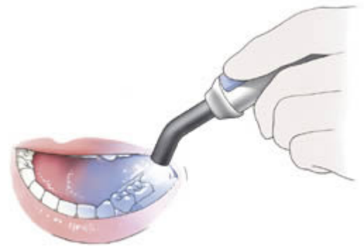
Verharden van de lak