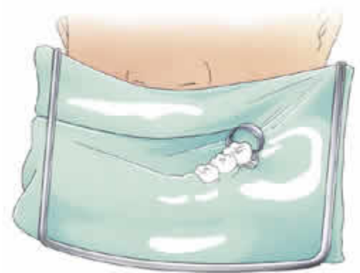
Soms komt er een heel dun rubber lapje in de mond

Dan moet de lak hard worden gemaakt. Dat gebeurt met een lamp die blauw licht geeft. Soms gebruikt de tandarts of mondhygiënist een oranje schermpje om de ogen tegen het blauwe licht te beschermen. Tenslotte controleert de tandarts of mondhygiënist of de lak goed op zijn plaats zit.