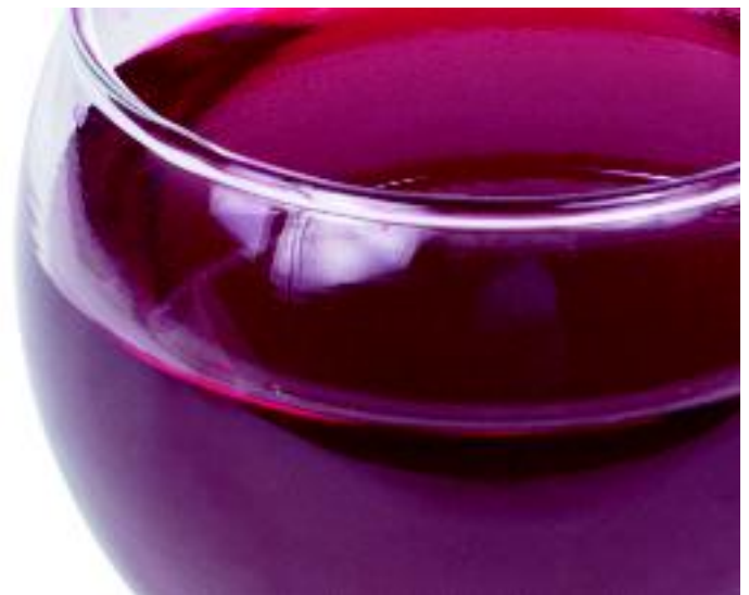
Zuur zit onder andere in wijn ...

Zuren in voeding en dranken kunnen tanderosie veroorzaken. Zuur zit onder andere in (sinaas)appels, citroenen, grapefruit, kiwi's, vruchtensappen, (light)frisdranken (ook ijsthee), wijn en bijvoorbeeld breezers. Tanderosie is een sluipend proces dat niet gemakkelijk te herstellen is. Het gaat niet alleen om hoeveél zure producten u eet en drinkt. Het gaat vooral om hoe vaak, hoe lang, de tijdstippen en de manier waarop u dat doet. Wanneer tanderosie niet wordt bestreden, kunnen zuren het tandglazuur en vervolgens zelfs het blootliggende tandbeen oplossen. Zie verder wat veroorzaakt tanderosie?