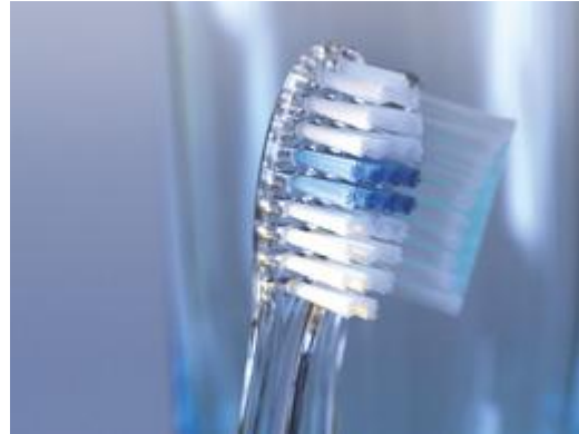
Gebruik een zachte tandenborstel

Probeer verkeerde gewoonten, zoals nagelbijten, kluiven op een pen of potlood, pijproken en de tanden als een schaar of mes geruiken af te leren. Dat kan moeilijk zijn, omdat u dit vaak onbewust doet. Tandknarsen doet u bijvoorbeeld tijdens de slaap. Overleg met uw tandarts of mondhygiënist hoe u dit probleem het beste kunt aanpakken.