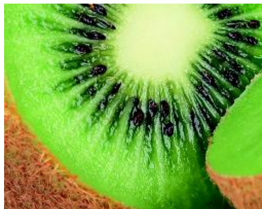
... in kiwi's en in citrusvruchten