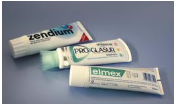
Gebruik een niet-schurende tandpasta