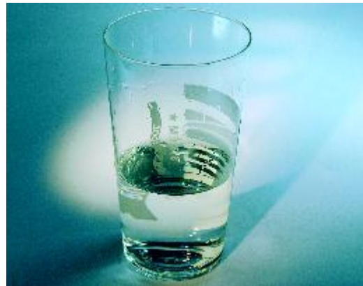
Neutraliseer zuur met water, melk of kaas