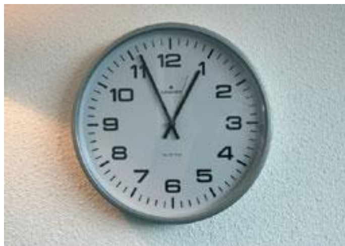
Eet of drink één uur voor het tandenpoetsen geen zure producten

Het oppervlak van tanden en kiezen wordt zachter door de inwerking van zuur. Als u direct na het eten of drinken van zuur uw tanden poetst, kunt u de glazuurlaag gemakkelijk wegpoetsen. Dan slijt uw gebit dus nog sneller.