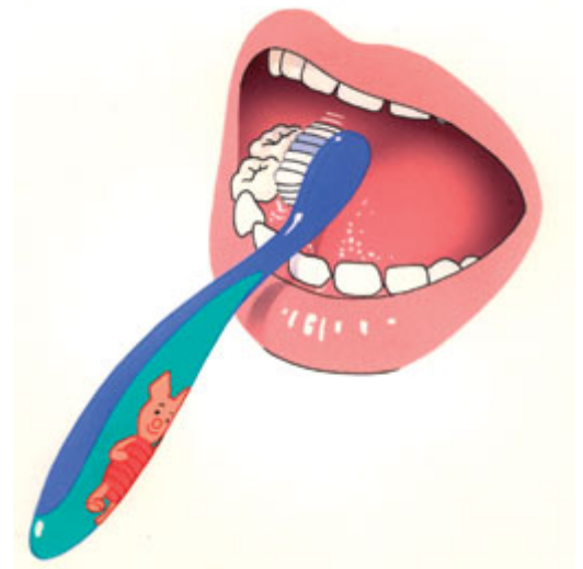
1. Begin beneden met de binnenkant.

Poets volgens de 3 B's: B innenkant, B uitenkant, B ovenop.