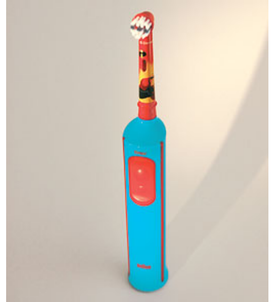
Elektrische tandenborstels voor kinderen hebben een speciale kleine borstelkop

Gebruik een tandenborstel met een kleine borstelkop met zachte haren en bij voorkeur met een lange steel. Zo komt u overal makkelijk bij. Kinderen vanaf drie jaar kunnen ook elektrisch poetsen. Er zijn speciale kinderborsteltjes. Die zijn kleiner en daarom geschikt voor de kindermond. Poetsen met een elektrische tandenborstel is juist leuk voor kinderen. Het draagt bij aan de motivatie om het gebit goed te verzorgen. Kies een tandpasta met fluoride. Fluoride zorgt voor de versterking van het glazuur. Voor kinderen tot en met vier jaar zijn er speciale peutertandpasta's. Hierin zit minder fluoride. Vanaf het vijfde jaar kan uw kind normale fluoridetandpasta voor volwassenen gebruiken. Er zijn ook tubes verkrijgbaar waarop staat 'juniortandpasta'. Kijk dan altijd naar de leeftijd die hierbij wordt aangegeven (bijvoorbeeld 5-12 jaar). Doe niet te veel tandpasta op de borstel. Een halve tot één centimeter is al voldoende.