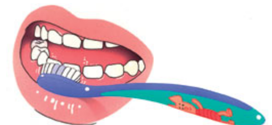
2. Dan de buitenkant