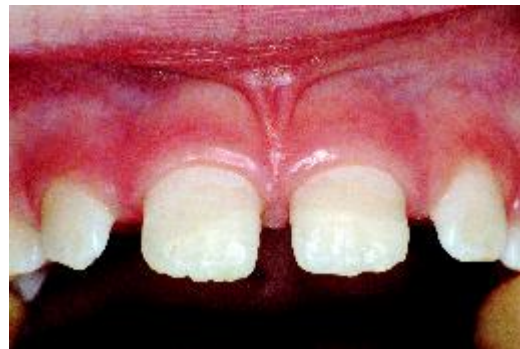
... en hersteld