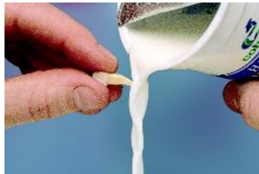
Spoel de tand af met melk