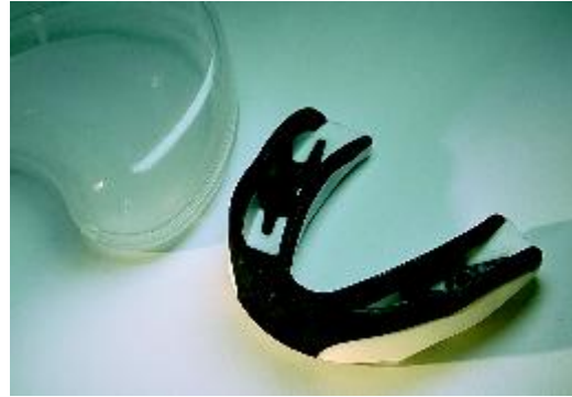
Gebitsbeschermer, te koop in sportwinkels

Gebitsletsel kunt u soms voorkomen. Tijdens het sporten kunt u bijvoorbeeld een gebitsbeschermer dragen. Die biedt geen garantie, maar kan de eventuele schade bij een ongeluk beperken. Er bestaan verschillende soorten beschermers. Kant-en-klare zijn te koop in sportwinkels. Deze passen vaak niet goed en beschermen daarom onvoldoende. Het beste werkt de gebitsbeschermer die precies op maat is gemaakt door uw tandarts.