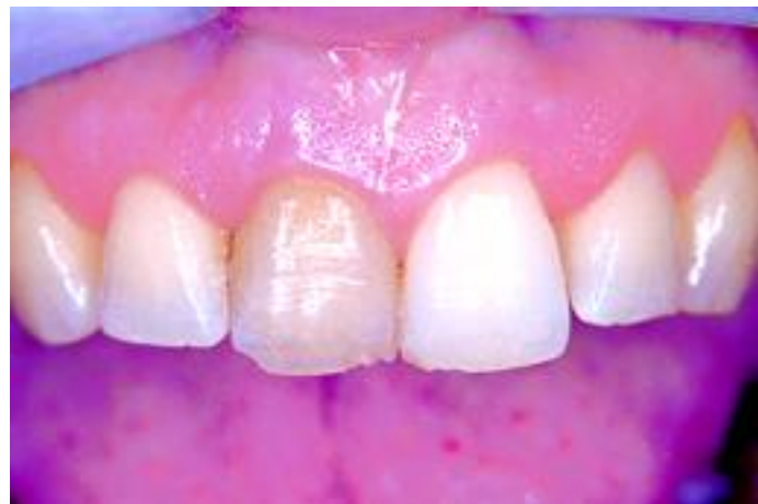
Verkleuring door een dode tand