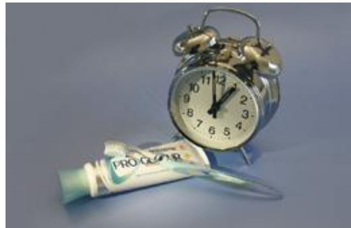
Gebruik geen zure producten één uur voor het tandenpoetsen